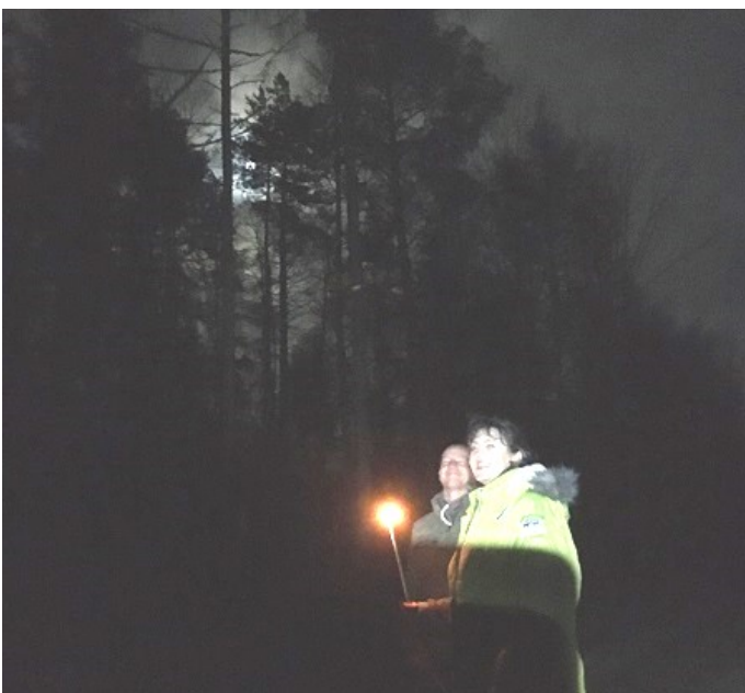
...und bei Mondschein, der sich mühsam durch die Wolken kämpft.