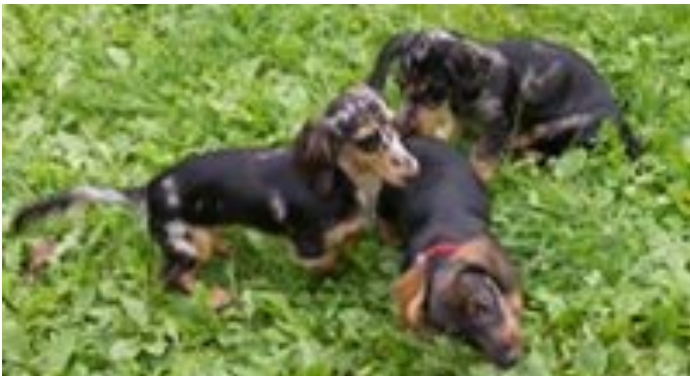
die Jüngsten dürfen sich austoben....