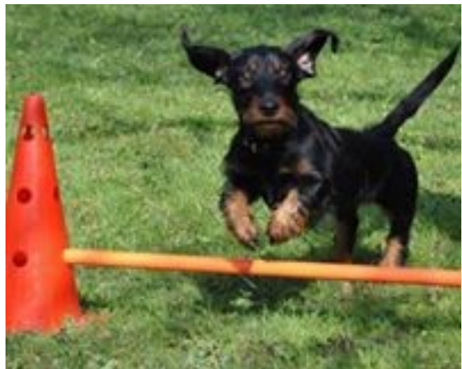
wer dann noch Lust hat hält sich fit bei Agility...