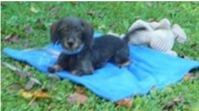
und zwischendurch was lernen...