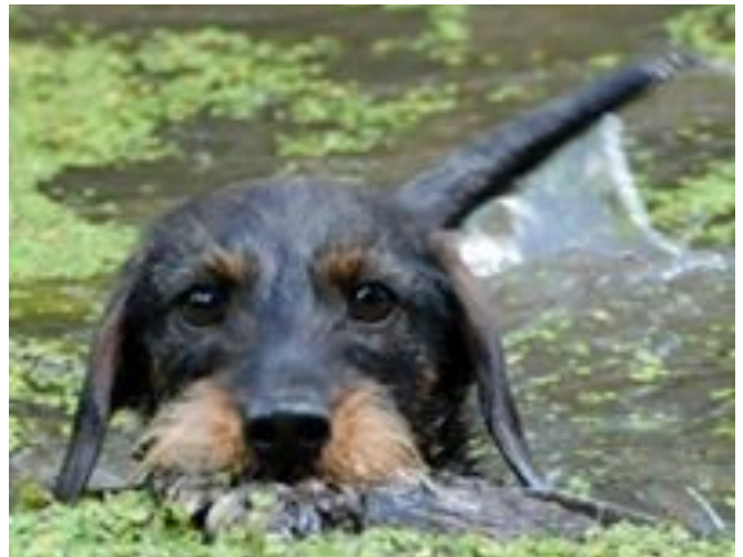
während die Größeren sich auf den Ernst des Lebens vorbereiten...