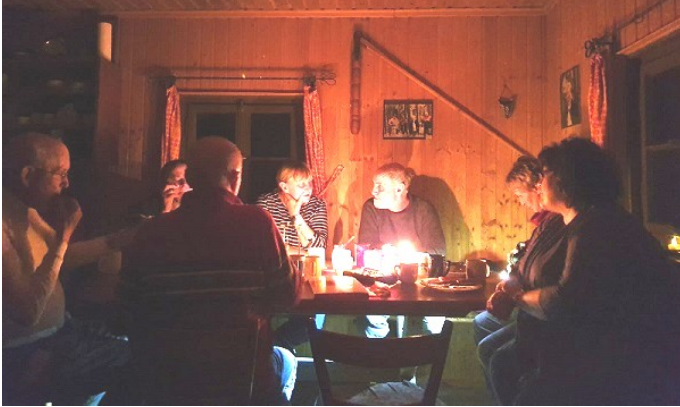
Romantik bei Kerzenschein