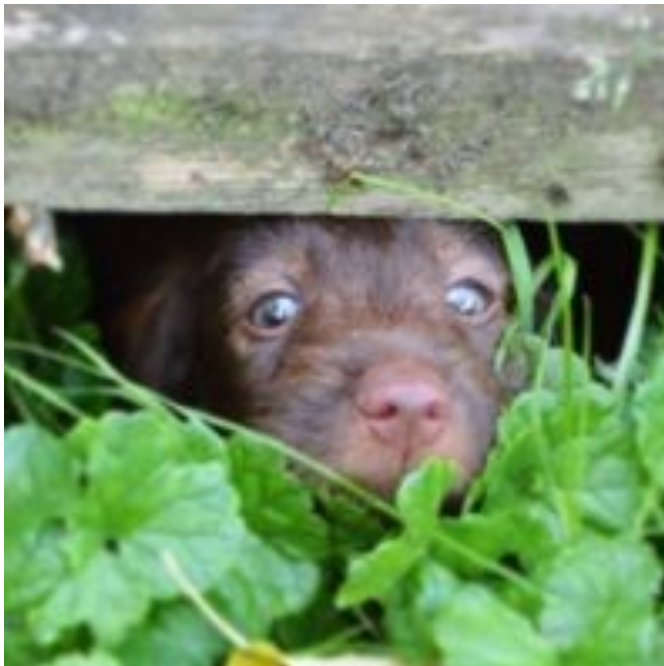
Unsere Team steht bereit....also schaut vorbei und habt Spaß