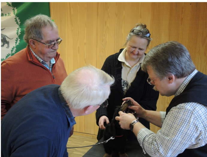
Fachmännisch wird die Anzahl der Zähne überprüft.

Während sich die einen Hunde geduldig der Untersuchung am Tisch ergaben, suchten die anderen ängstlich Schutz bei Herrchen oder Frauchen. Einige wenige hielten gar nichts davon, sich ins Maul schauen zu lassen, und wehrten sich vehement dagegen. Aber Widerstand war zwecklos!