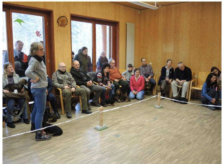
Gespannte Aufmerksamkeit bei Zuschauern und Zaungästen.