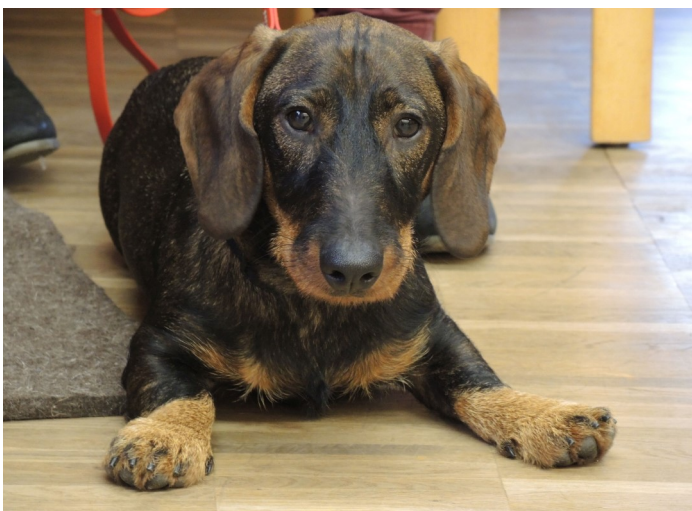
Die Zuchtschau in Einsiedel erfreut sich nicht nur bei den Ausstellern sehr großer Beliebtheit.

Sie finden uns auch im Internet unter: www.dcn-wuerzburg.de oder auch www.dcn-ev.de