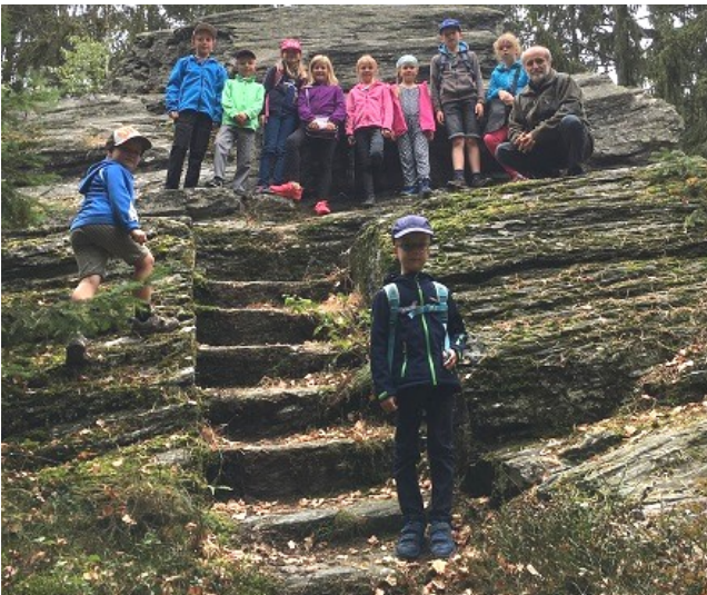
Die „Mutigsten“ bei der Besteigung des Wendener Steines