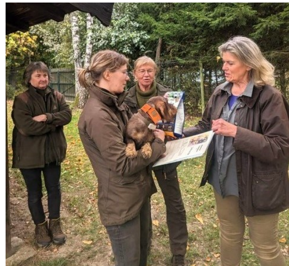
Toblerone vom alten Fritz