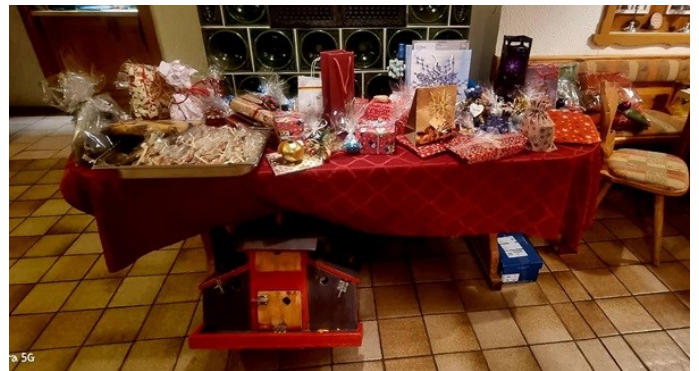
...und die Preise für die Tombola waren wieder gigantisch!