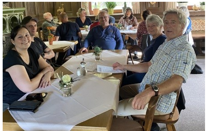
...und gemütliches Beisammensein im Gasthof Blei