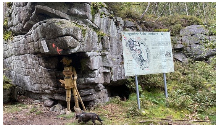
Burgruine Schellenberg ...