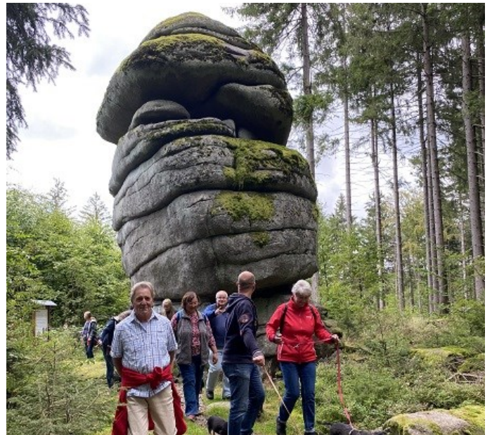
Der imposante Brotfelsen...