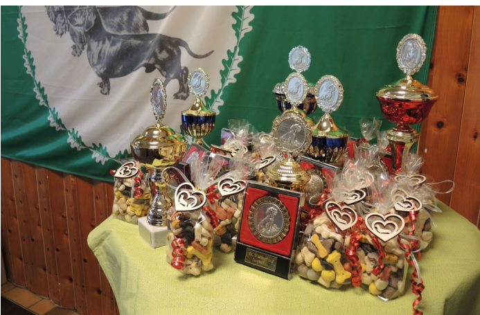
Schöne Pokale für die Sieger, Medaillen für die Platzierten und Leckerlis wurden vergeben.

Dichtes Gedränge herrschte am Samstagvormittag am Eingang zum Sportheim Sebastianihaus in Oberschwarzach und immer wieder war freudiges Bellen oder aufgeregtes Winseln zu hören, unterbrochen von Kommandos wie „Schluss, Ruhe, aus“, was die Verursacher dieser Geräusche nur wenig zu beeindrucken schien. Dackel sind neugierig, besser gesagt wissensdurstig, und ungeduldig. In der Schlange stehen ist nicht unbedingt ihre Leidenschaft. Der Grund dafür war die Herbst-Zuchtschau unserer Sektion, die diesmal im landschaftlich reizvollen Steigerwald abgehalten wurde, da unser traditionelles Ausstellungslokal im Waldhaus Einsiedel gerade saniert wird.