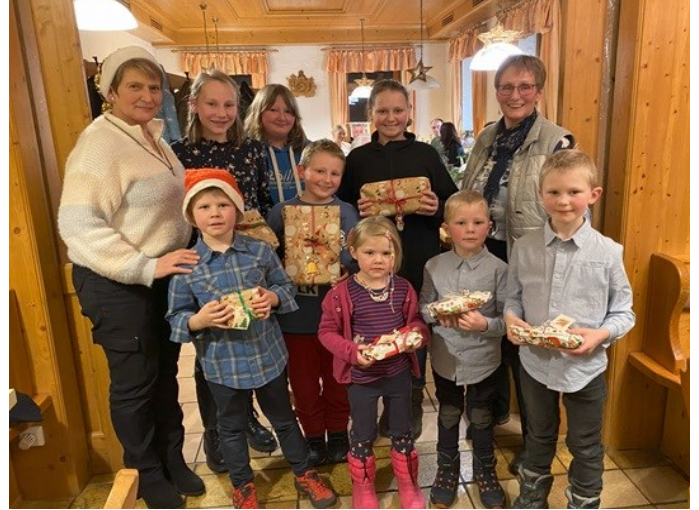
Die Kinder freuten sich über die Bescherung..